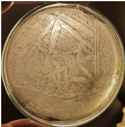
Bild 2 und 3 (jeweils dieselbe Probe, rechts mit nachgezeichneten Strukturen):

Die Probe zeigt ein relativ chaotisches Bild mit wenig erkennbaren, geordneten Strukturen.